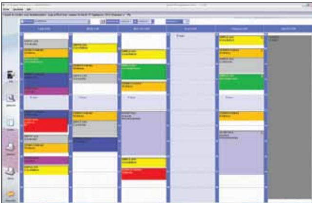
L'agenda pour des journées bien organisées

Un livre de rendez-vous bien tenu permet de travailler plus efficacement et sereinement. D'un simple coup d'œil, vous visualisez l'ensemble des rendez-vous du cabinet. Tirez parti de la souplesse de paramétrage, des codes couleurs, de la gestion des rendez-vous non honorés... D'un simple clic, on vous signale l'arrivée des patients. Rapide et discret.