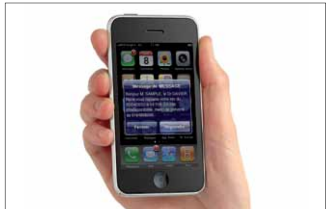
Relance de rendez-vous par SMS

Grâce au service SMS*, profitez d'un moyen simple, rapide et économique pour rappeler les rendez-vous à vos patients et éviter tout oubli. Un service rentabilisé dès le premier rendez-vous manqué évité et qui valorise l'image de votre cabinet.