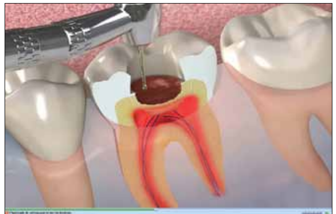
Informez et motivez les patients

Avec le logiciel Communicator*, découvrez un formidable outil de communication pour motiver vos patients. Intégré à CS Trophy Gestion, il permet des explications claires et pédagogiques pour obtenir le consentement éclairé du patient, et enregistrer la preuve de sa bonne information dans son dossier.