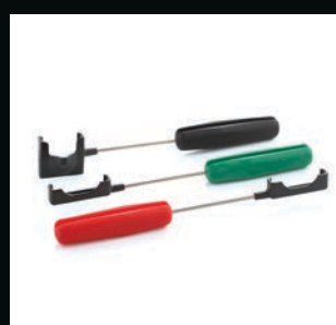
Manches type brosse à dents