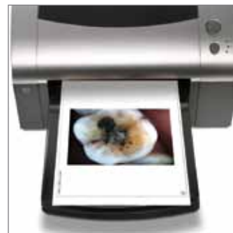
Imprimer l'image sur n'importe quel type d'imprimante.