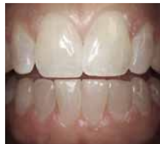
Écarteur dentaire standard.

Visualisez les détails les plus fins à l'aide de vues nettes et aux couleurs réalistes.