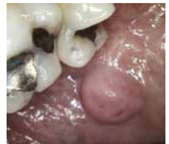
Conduit salivaire gonflé.