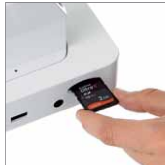
Enregistrer l'image sur votre ordinateur ou sur une carte SD