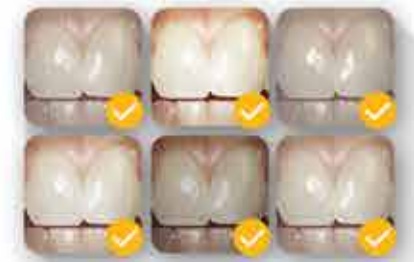
Schéma de teintes intelligent

BRDF : distribution bidirectionnelle de la réflectance